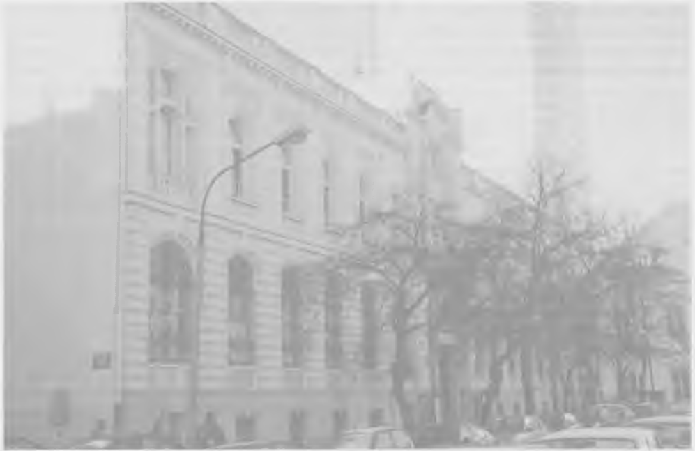
Gmach Banku Handlowego Wilhelm Landau w Warszawie, wzniesiony w latach 1904–1906 przez Gustawa Landaua

burskiego i rosyjskiego rynku pieniężnego podkopało pozycję firmy. Na żądanie wierzycieli władze niemieckie ustanowiły zarząd przymusowy. Do końca wojny bank utracił ok. 1/3 kapitału zakładowego. W niepodległej Polsce nie powrócił już do dawnej świetności. W 1919 roku próbowano zainteresować bankiem kapitał brytyjski, ale nic z tego nie wyszło. W 1925 roku firma została postawiona w stan likwidacji. W tym roku wspaniała siedziba banku przy Senatorskiej w Warszawie przeszła na własność Polskiego Banku Przemysłowego SA.