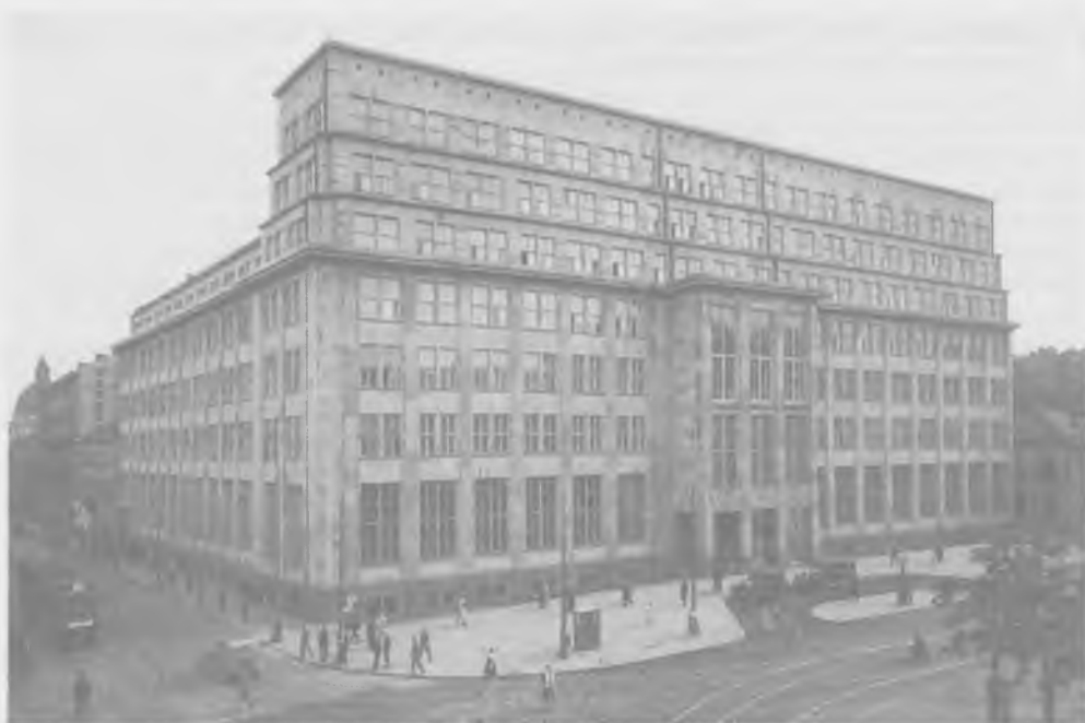
Gmach Banku Gospodarstwa Krajowego w Warszawie, wzniesiony w latach 1928–1931 wg projektu Rudolfa Świerczyńskiego. Stan w roku 1932

Bank Gospodarstwa Krajowego utworzony został na mocy rozporządzeń prezydenta z 30 i 31 maja 1924 roku. Powstał z fuzji trzech wywodzących się z Galicji banków publicznych: Polskiego Banku Krajowego (d. Banku Krajowego), Państwowego Banku Odbudowy