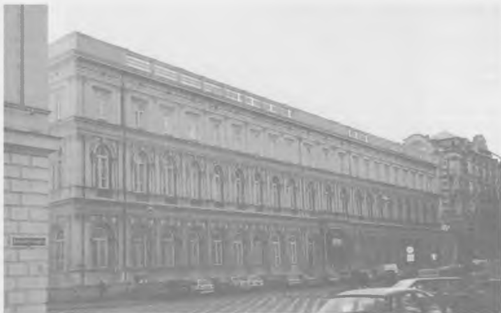
Gmach warszawskiego Towarzystwa Kredytowego Ziemskiego, wzniesiony w latach 1854–1856 wg projektu Henryka Marconiego. Stan w roku 1997