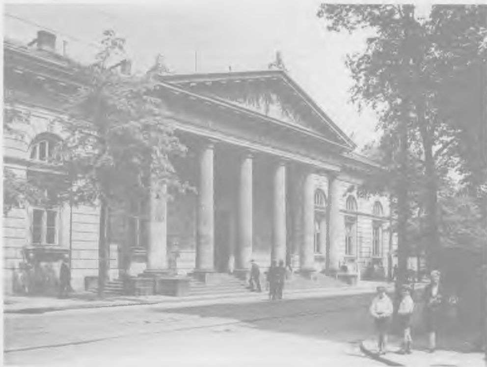
Giełda Pieniężna w Warszawie przy ul. Królewskiej. Stan w roku 1932

Reformy Władysława Grabskiego w 1924 roku doprowadziły do stabilizacji walutowej. W miejsce PKKP utworzony został niezależny od rządu Bank Polski SA, który emitował złote. Grabski, będący zwolennikiem liberalizmu gospodarczego, chciał zarazem zbudować silny sektor państwowy w bankowości. Stanowisko takie wynikało ze świadomości słabości rodzimego kapitału. W 1924 roku dokapitalizowano PKO i PBR, a trzy wywodzące się z Galicji banki publiczne połączono w Bank Gospodarstwa Krajowego (BGK). Zgodnie z planami Grabskiego celem banków państwowych była odbudowa kredytu długoterminowego. Banki prywatne miały się skoncentrować na kredycie krótkoterminowym. Prawo bankowe z 1924 roku opierało się na