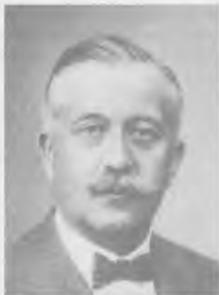
Stanisław Lubomirski (1875–1932)