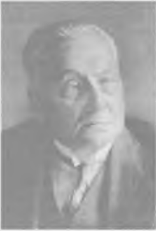
Stanisław Karpiński (1870 – 1943) prezes Banku Polskiego w latach 1924 – 1929

wynikał kurs 5,187 zł za 1 dolara. Zlikwidowana została Polska Krajowa Kasa Pożyczkowa, a marki polskie wymieniono na złote w relacji 1,8 mln mp za 1 zł. Bank Polski emitował banknoty oparte na systemie Gold Exchange Standard, tzn. w skład pokrycia emisji zaliczano zarówno złoto, jak i zagraniczne waluty i dewizy wymienialne na złoto. Pokrycie nie mogło być mniejsze niż 30%. W rękach skarbu państwa pozostała emisją monet srebrnych, bilonu i biletów skarbowych, jej rozmiary były jednak ustawowo ograniczone. Reformy W. Grabskiego zakończyły się sukcesem i przyniosły kres inflacji w Polsce. Istotne było, że przeprowadzono je, opierając się wyłącznie na wewnętrznych zasobach kapitałowych, bez kredytów zagranicznych, które w tym okresie mogły wiązać się z naciskami politycznymi zmierzającymi do rewizji zachodnich granic Polski.