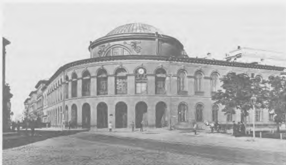
Gmach Banku Polskiego w Warszawie, wzniesiony w latach 1825 – 1829 przez Antonigo Corraziego i Jana Jakuba Gaya. Stan przed rokiem 1914