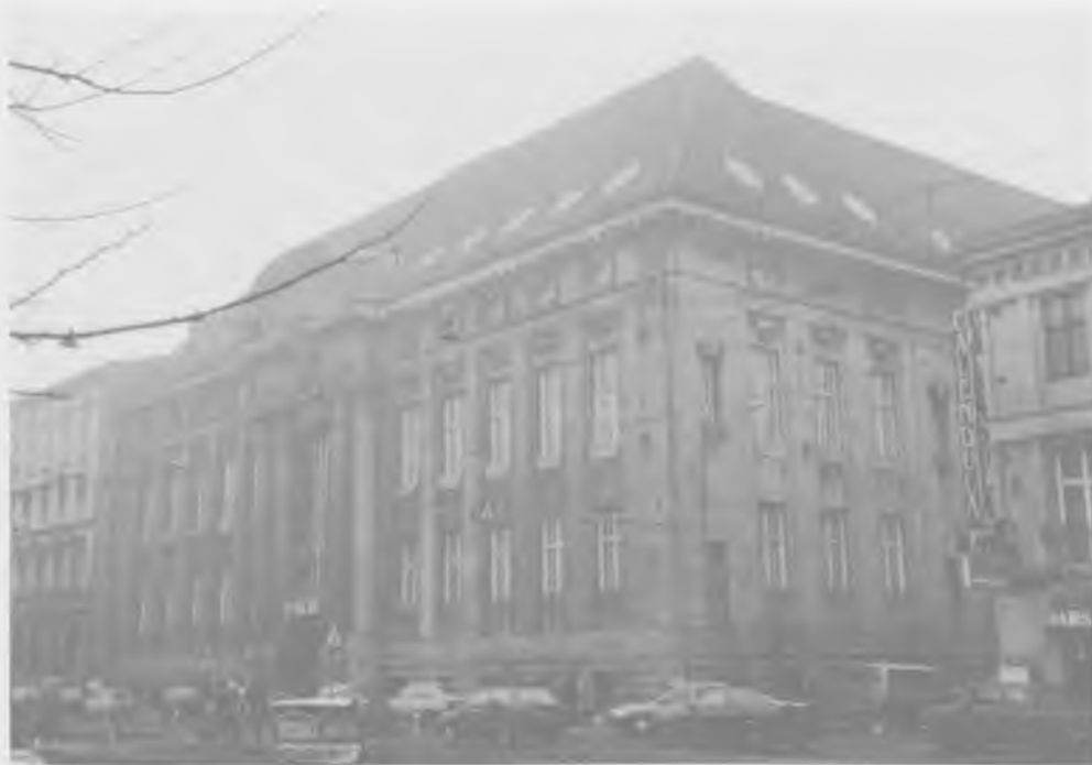
Gmach Banku Handlowego w Łodzi, wzniesiony na początku XX wieku. Stan w roku 1997