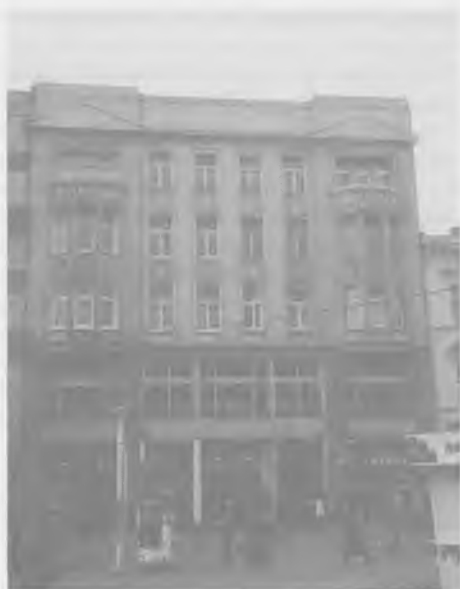
Bank Polskich Kupców i Przemysłowców Chrześcijan w Łodzi SA. Stan w roku 1997

W. Morawski – Mniejsze banki krakowskie, SBP, „Gazeta Bankowa” nr 9/1990