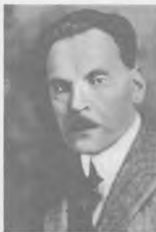
Władysław Wróblewski (1875 – 1951) w latach 1929 – 1936 prezes Banku Polskiego SA, w latach 1933 – 1939 prezes Banku Akceptacyjnego SA