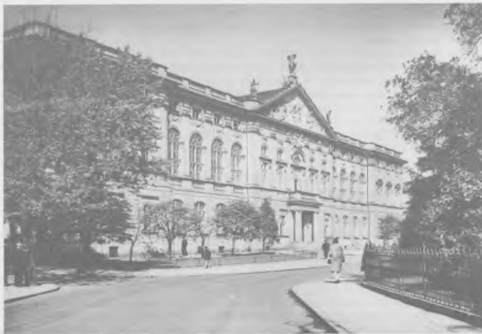
Pałac Krasińskich w Warszawie, siedziba Głównej Kasy Wymiany Księstwa Warszawskiego. Stan w roku 1930