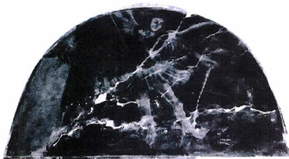
Quis ut Deus ?

filarami, aby od wewnątrz przylegały one do ścian tworząc po bokach ciąg płytkich wnęk lub kaplic (stąd odmiana wnękowa lub kaplicowa) 28 . Kościół węgrowski wzniesiono w odmianie kaplicowej podobnie jak wcześniej kościoły reformatów w Warszawie (1680 r.), Białej Podlaskiej (1684 r.) i później w Miedniewicach (1748 r.) 29 . Ściany nawy są rozczłonkowane parami toskańskich pilastrów 30 . Podwójne pilastry są charakterystycznie nie tylko dla kościołów reformackich, ale w ogóle dla kościołów barokowych. Taki zabieg zastosowano w kościele Il Gesu i można go znaleźć w wielu kościołach w Polsce choćby w kościele św. Apostołów Piotra i Pawła w Krakowie (jezuitów) św. Bernardyna ze Sienny w Krakowie (bernardynów). W przypadku reformatów podwójne pilastry występują znacznie częściej w prowincji wielkopolskiej niż małopolskiej. Na skrzyżowaniu nawy z transeptem ślepa kopuła. Kopuła na skrzyżowaniu nawy z transeptem również jest elementem barokowym znanym z kościoła Il Gesu. Jednak w Węgrowie zastosowano ślepa kopułę a wynika to z przepisów budowlanych reformatów, które zabraniają kopuły w ich kościołach. Ślepa kopuła jest kopułą widoczną tylko od wewnątrz, w bryle zewnętrznej kościoła jest niewidoczna. Podobny zabieg stosują także karmelici bosy, którym przepisy budowlane również zabraniają kopuły w kościołach 31 .