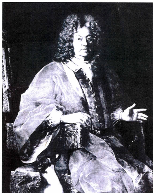
Jan Dobrogost Krasiński, mal. Michelangelo Palloni, ok. 1700, ze zbiorów Muzeum Pałacu Króla Jana III w Wilanowie