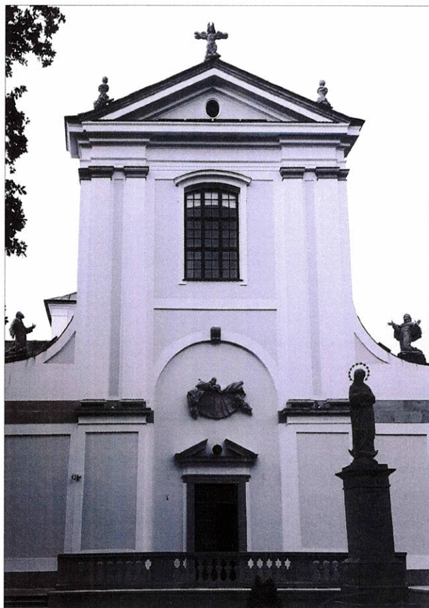
Elewacja frontowa kościoła reformatów w Węgrowie.

Kościół węgrowski jest typowym kościołem reformatów, zachowującym charakterystyczne dla tego zakonu elementy.