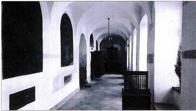
Krużganki w klasztorze reformatów w Węgrowie.